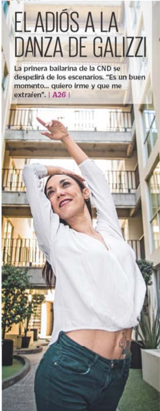
GERMÁN ESPINOSA. EL UNIVERSAL

La primera bailarina de la CND se despedirá de los escenarios. "Es un buen momento... quiero irme y que me extrañen". | A26 |