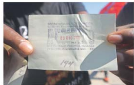
El pase de abordar que les venden consiste en un papel sellado con fecha del año pasado.