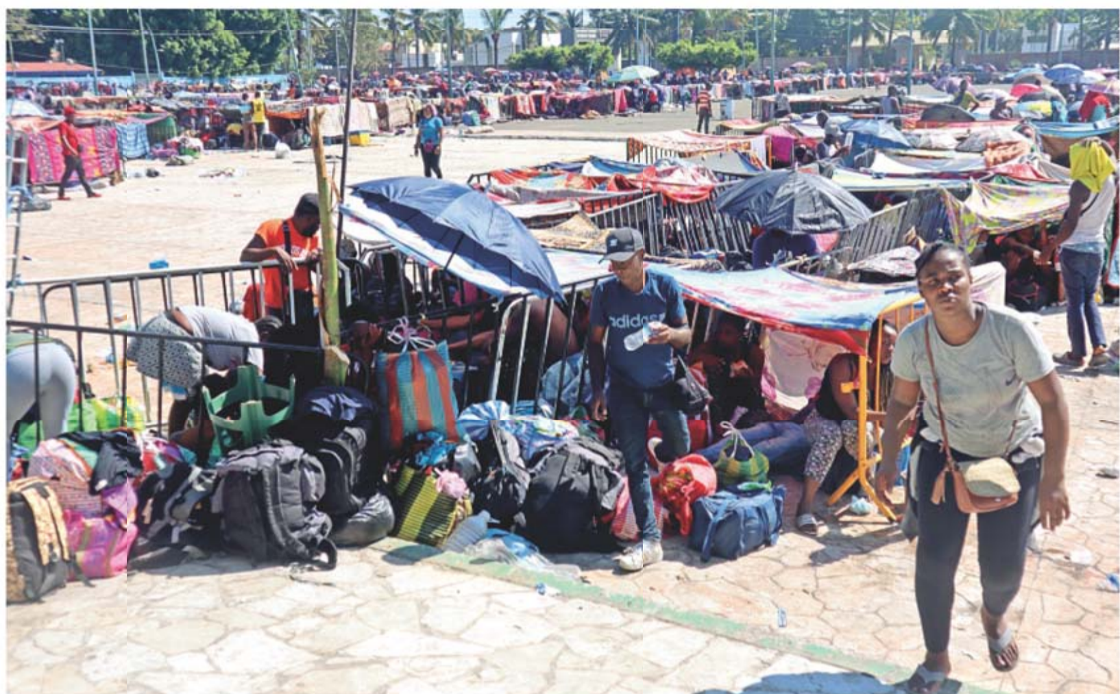
Desde hace tres semanas alrededor de 7 mil haitianos acampan en el Estadio Olímpico, mientras esperan turno para resolver su situación migratoria.