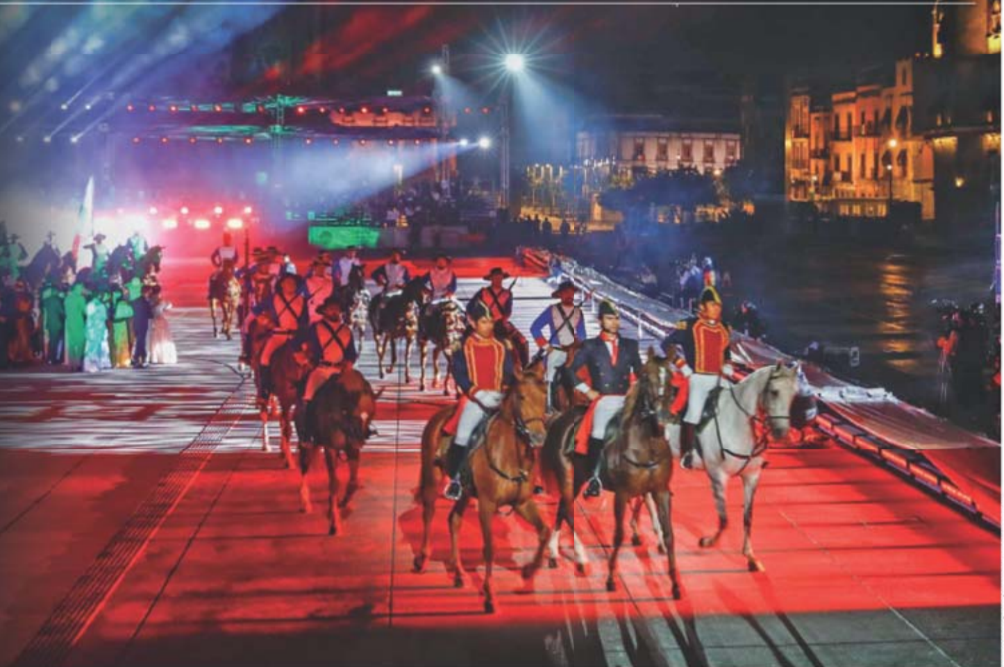
DEIGO SIMÓN SÁNCHEZ, EL UNIVERSAL