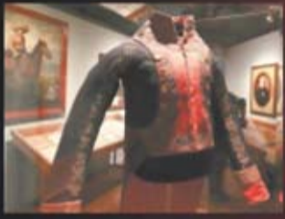
REFERENCIA FREGOSO, EL UNIVERSAL