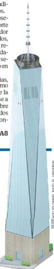
MODELAO 3D: DANIEL RAZO, EL UNIVERSAL