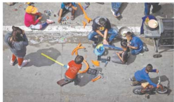
“Unos señores malos nos dieron cuatro horas para salir o nos quemaban”, dice un niño de Michoacán que ahora vive en Tijuana.