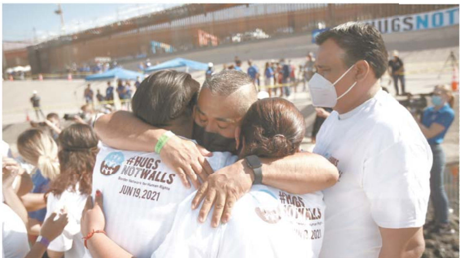
La frontera entre Ciudad Juárez y El Paso se abrió durante tres minutos para que familias separadas pudieran abrazarse