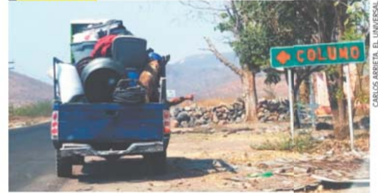
CARLOS ARRIETA/EL UNIVERSAL