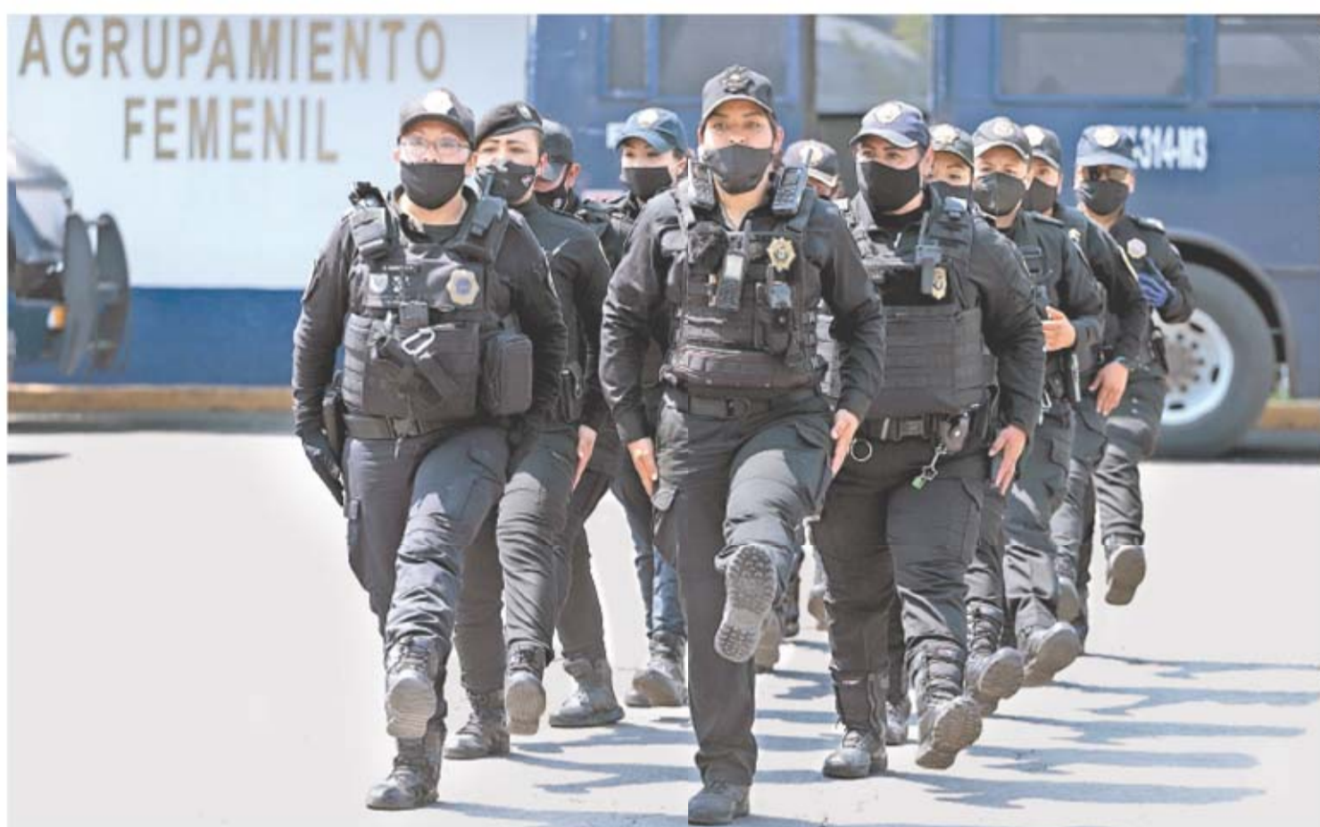
Integrantes de la Policía Metropolitana Femenil Ateneas realizan ejercicios como parte de su preparación para la marcha del 8 de marzo.