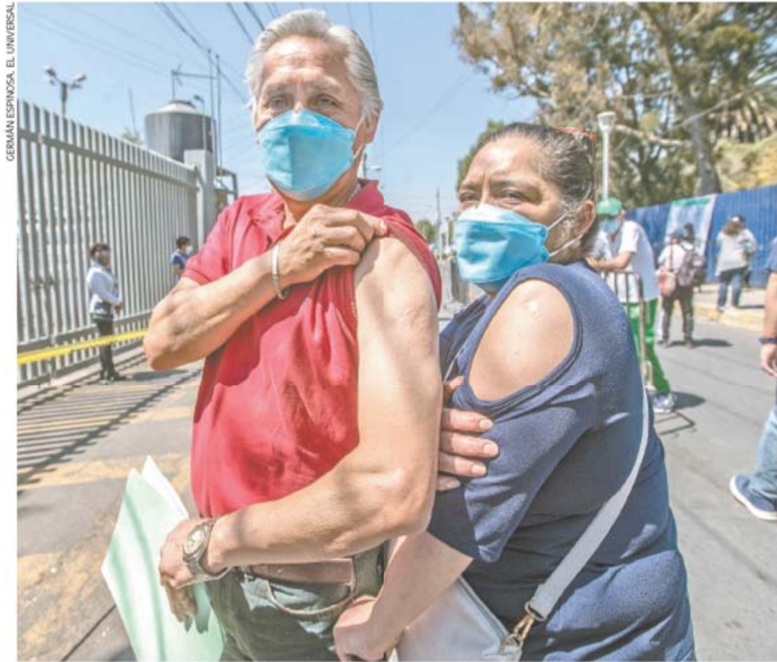
IMAGEN DEL DÍA FELICES DE ESTAR VACUNADOS

ALERTA MUNDIAL COVID-19 EN MÉXICO 2,076,882 CASOS CONFIRMADOS 184,474 MUERTOS