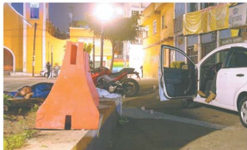
Las víctimas convivían frente a la iglesia del pueblo de Culhuacán, en la alcaldía Iztapalapa, cuando un grupo armado las atacó.

Claudia Sheinbaum, jefa de Gobierno, afirmó que "la Secretaría de