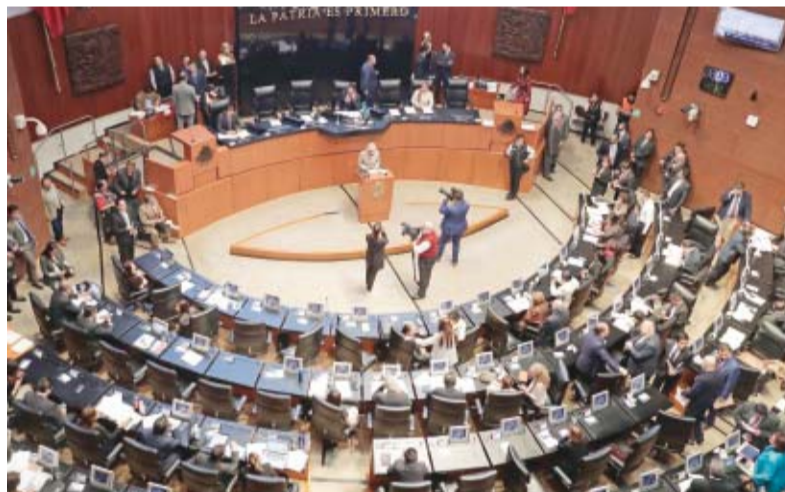
Olga Sánchez Cordero presentó en el Senado su proyecto sobre el uso lúdico de la marihuana y argumentó que la regulación ayudará a pacificar al país.