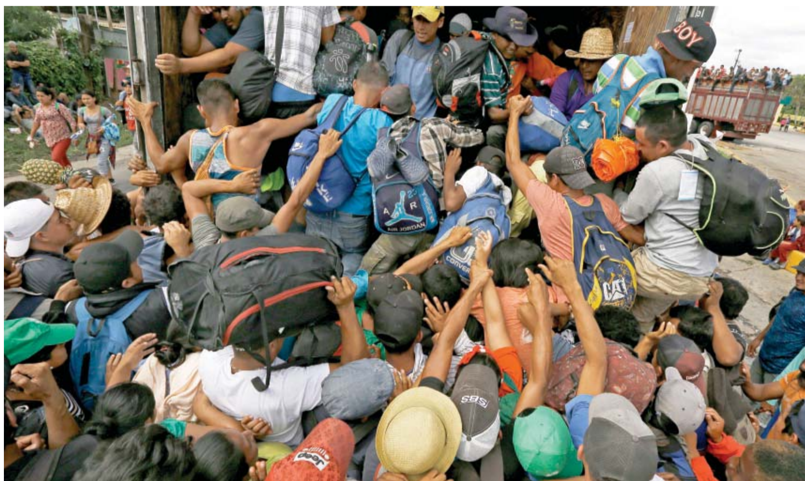
Ante la falta del transporte prometido por el gobierno de Veracruz para su traslado a la Ciudad de México, migrantes se aglutinan para aprovechar un aventón.

● Migrantes no logran un plan; se dividen por nacionalidades ● ONU critica: se perdió el rastro de parte de los viajantes