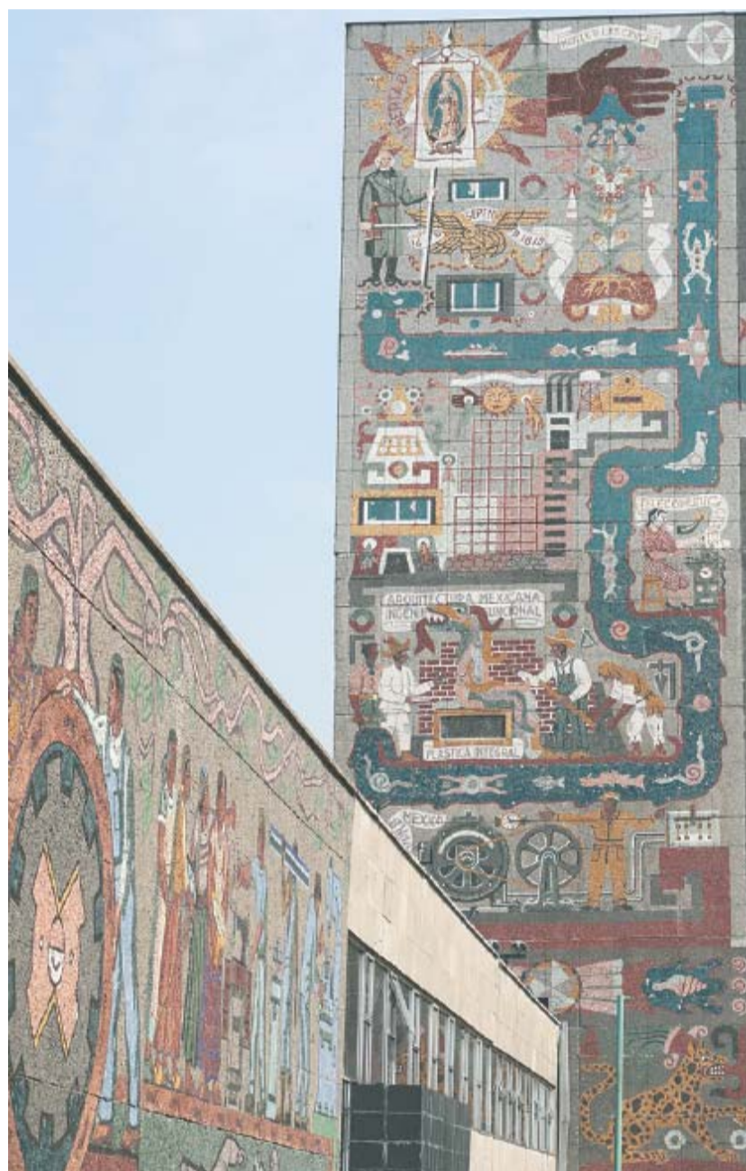
El conjunto artístico que será removido de la sede de la SCT abarca 6 mil metros cuadrados e incluye obras de artistas como Juan O’Gorman.

Detrás de las estadísticas hay una maquinaria que impacta el patrimonio de los ciudadanos. Informes de inteligencia, expedientes y agentes de investigación consultados dan cuenta, en este primero de dos reportajes, del modus operandi y la peligrosidad de las bandas dedicadas a este ilícito. ● Redacción NACIÓN A18