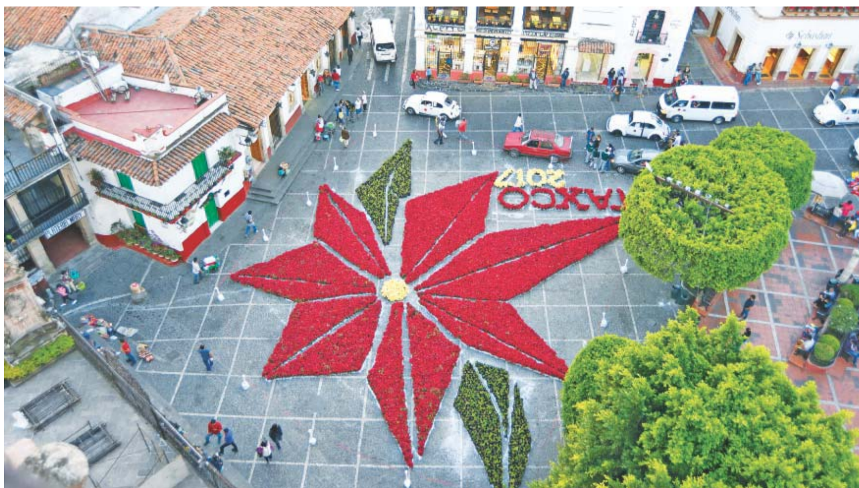
En Taxco, un banco de semillas resguarda el ADN de la Cuetlaxóchitl original. En la imagen, un arreglo formado con varias de esas flores en el centro del pueblo.