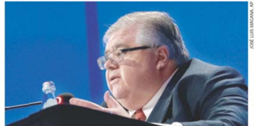
Carstens está a casi un mes de dejar el cargo como gobernador de Banxico.

LEONOR FLORES Enviada —cartera@eluniversal.com.mx