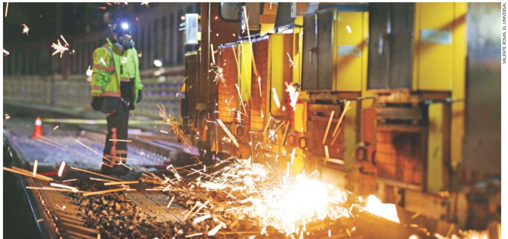
Cada noche las vías de la Línea 12 del Metro son sometidas a un proceso de reperfilado, el cual se realiza con maquinaria especializada.

Nota: no se muestra porcentaje de Ni aprueba ni reprueba v No Sabe/No Contestó