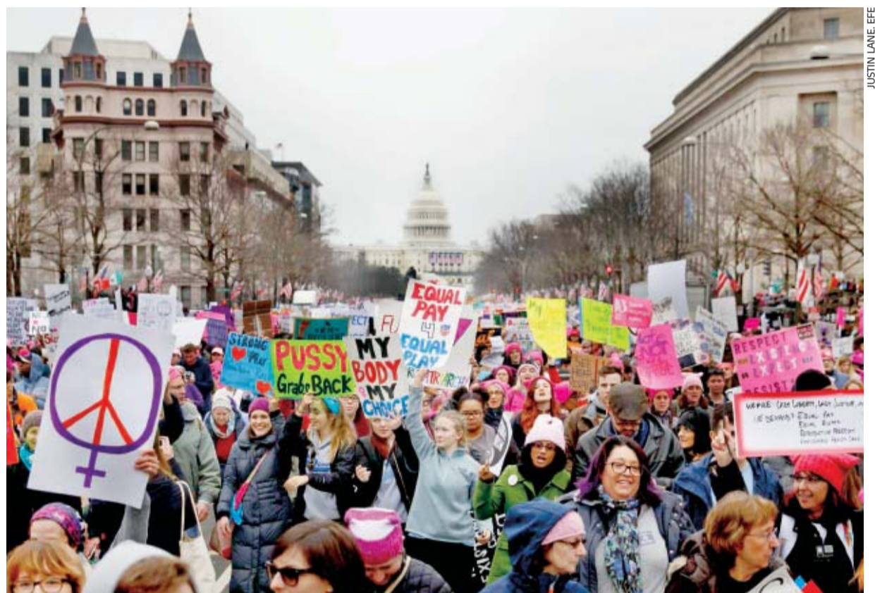
Miles de personas marcharon ayer en Washington para exigir respeto a las mujeres por parte del presidente Donald Trump. Las protestas se replicaron en diversas ciudades alrededor del mundo.