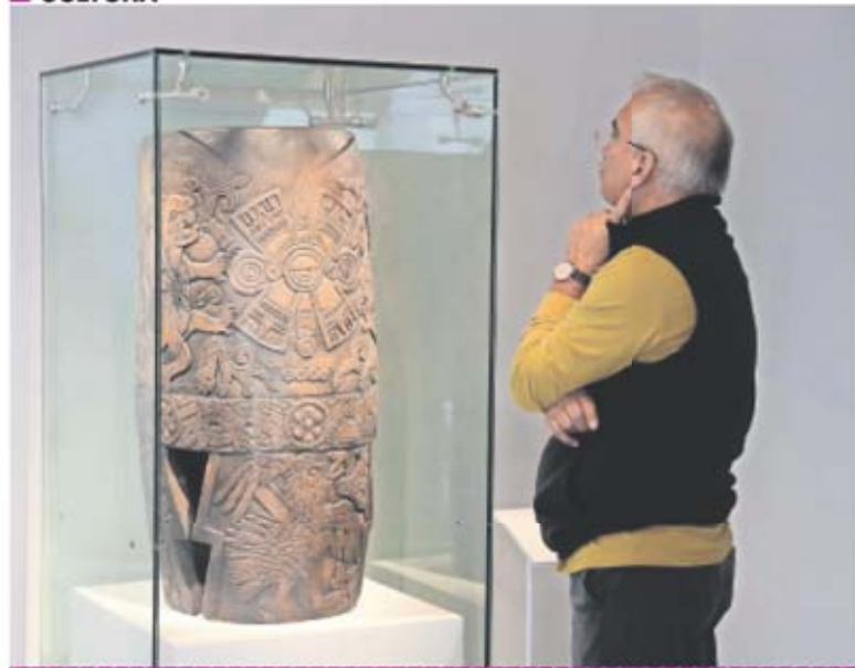
DEGO SIMÓN SÁNCHEZ, EL UNIVERSAL