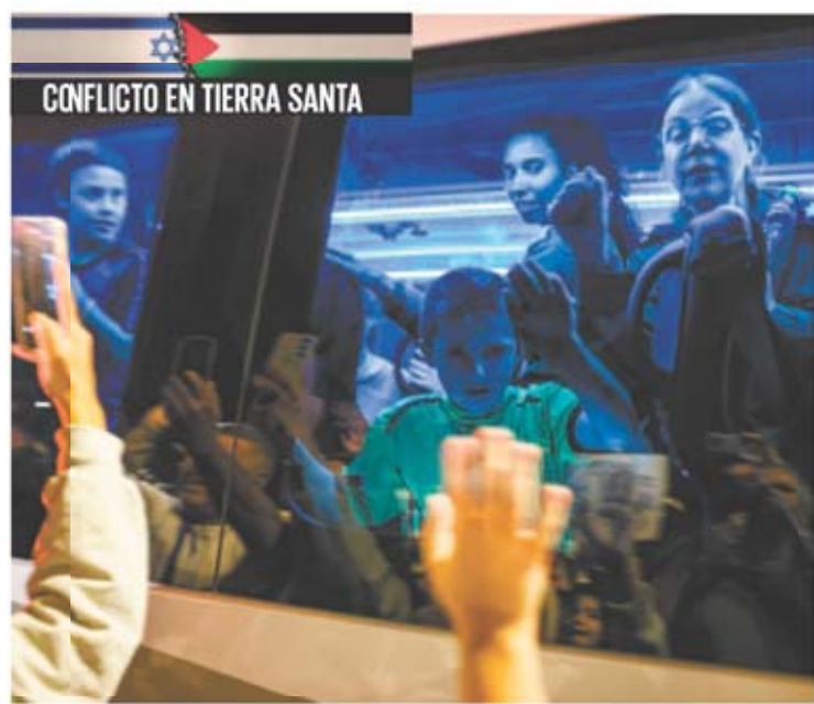
CONFLICTO EN TIERRA SANTA

Camino a Ofakim. — Israelíes liberados por Hamas saludan a la gente de camino a la base israelí de Ofakim para una primera evaluación. La tercera jornada de cese al fuego transcurrió sin incidentes y con la liberación de 17 rehenes por parte del grupo islamista, incluyendo a una niña israelo-estadounidense, un israelí con nacionalidad rusa y tres tailandeses. Israel liberó a 39 presos palestinos. Con la entrega de más rehenes, Hamas busca extender el cese al fuego más allá de hoy, cuando concluye el acuerdo original. | MUNDO | A28