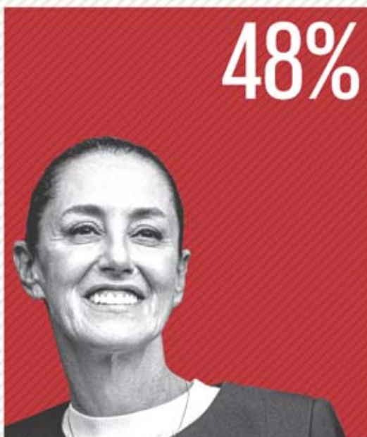
Claudia Sheinbaum (Morena-PT-PVEM)

Tras la virtual conformación definitiva de la boleta electoral rumbo a los comicios presidenciales de 2024, la exjefa de Gobierno capitalino inicia en la delantera con 48% de intención del voto, muestra una encuesta de Buendía & Márquez para EL UNIVERSAL. Su principal rival, Xóchitl Gálvez, tiene 24%, mientras que Samuel García comienza la carrera con apoyo de 8%. Sin embargo, el gobernador de Nuevo León presenta un balance positivo en cuanto a opinión ciudadana, lo que puede mejorar su posicionamiento durante el proceso.