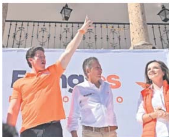
SAMUEL PIDE NO TEMER A UN CANDIDATO JOVEN | NACIÓN | A8