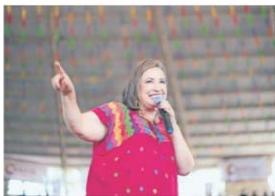
"ZACATITO PA' L CONEJO", SE MOFA XÓCHITL | NACIÓN | A8