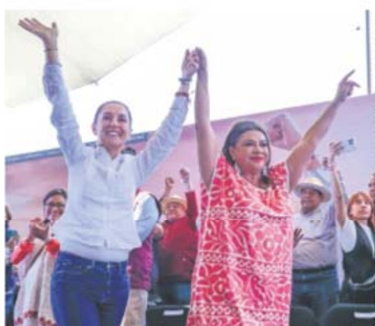
CLAUDIA: VAMOS POR "EL CARRO COMPLETO" EN LA CDMX | NACIÓN | A6

En el país, 83 institutos políticos buscan mantener registros para conservar financiamientos millonarios