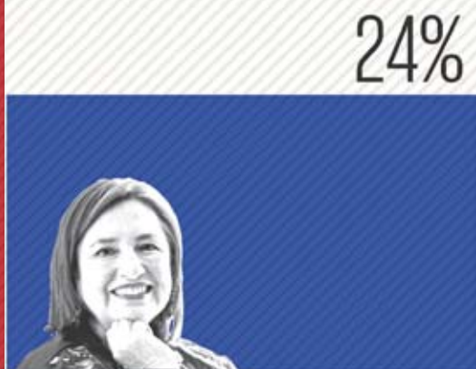
Xóchitl Gálvez (PAN-PRI-PRD)

Preferencia electoral de Presidente Si hoy fuera la elección para elegir Presidente, ¿por cuál candidato votaría?