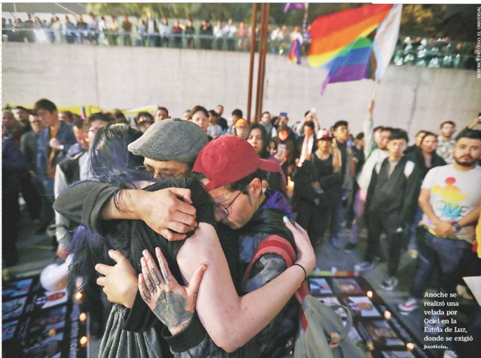
Anoche se realizó una velada por Ociel en la Estela de Luz, donde se exigió justicia.