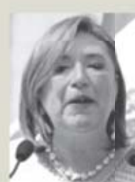
CARLOS MEJÍA, EL UNIVERSAL