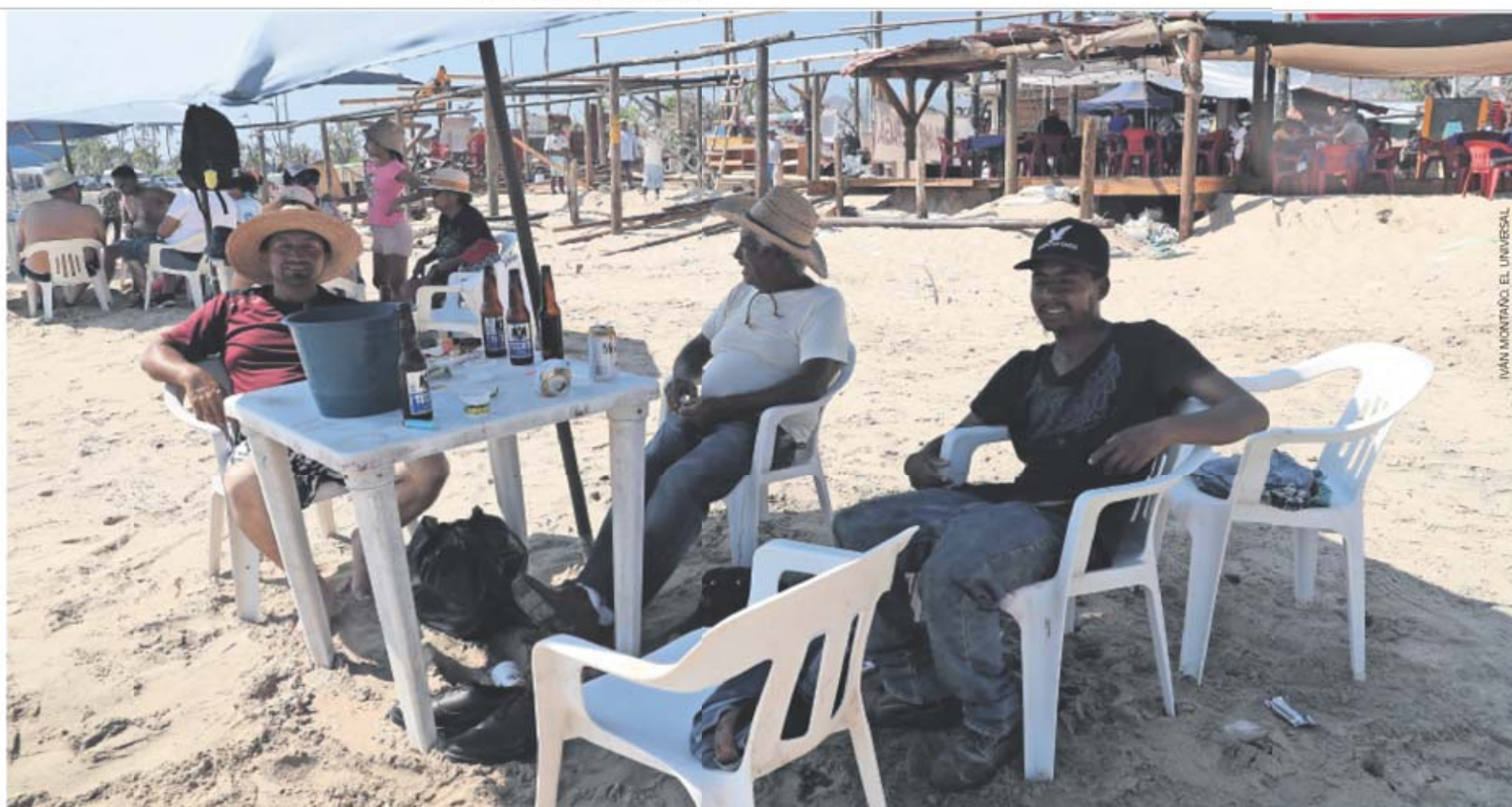
Trabajadores aseguran que es tiempo de apoyar a la gente que vende comida y dar propina a los meseros, pues "ahora es cuando más lo necesitan".