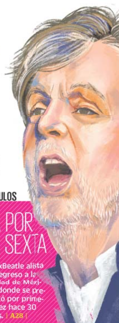
ANI CORTÉS, EL UNIVERSAL