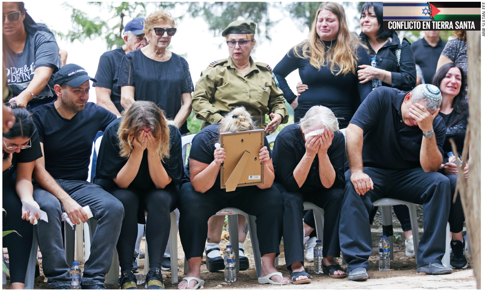
Israelíes participan en el funeral del soldado Yuval Ben Yaakov, muerto en combates con militantes de Hamas en la frontera con Gaza.