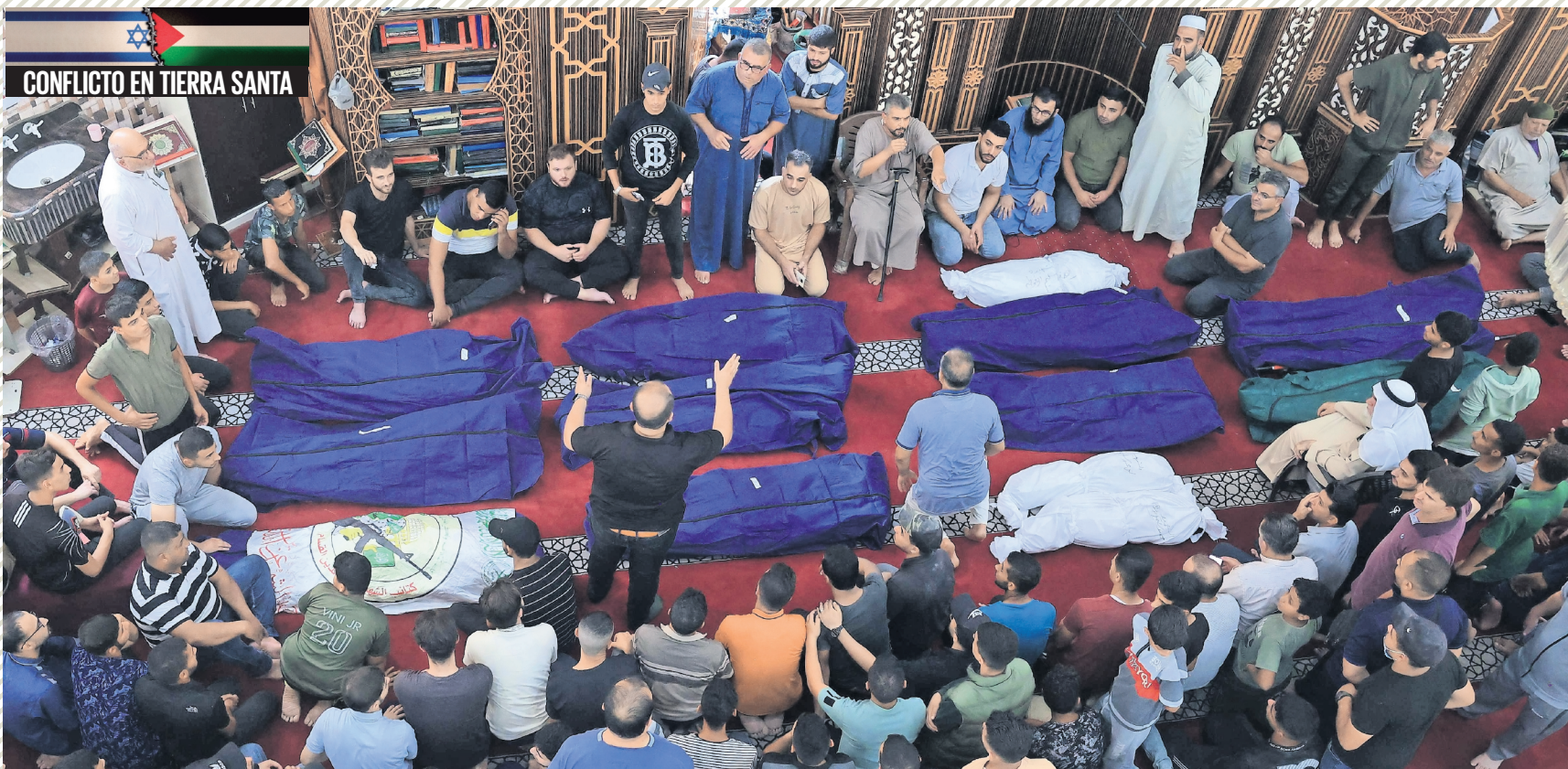
Una familia palestina muerta en un ataque aéreo israelí recibe las honras fúnebres en una mezquita en la ciudad de Rafah, al sur de la Franja de Gaza.