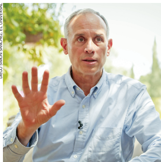
López-Gatell dice que su trabajo en la pandemia fue un catalizador para servir a la transformación.