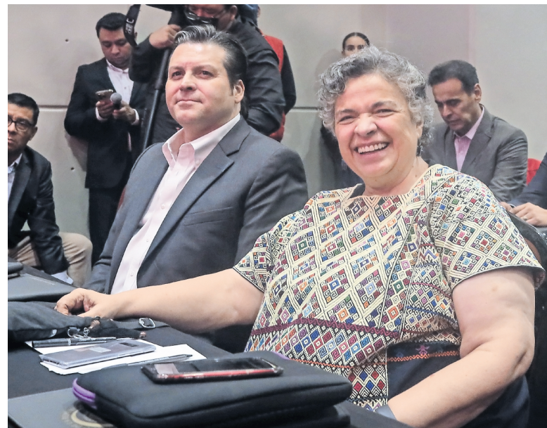
Beatriz Paredes dijo que analizará su futuro como aspirante presidencial hasta que conozca los resultados oficiales de las encuestas del Frente.

Uno de los escenarios es que la encuesta se realice y se adelanten los resultados para definir por default a una ganadora, sin hacer la votación primaria del domingo