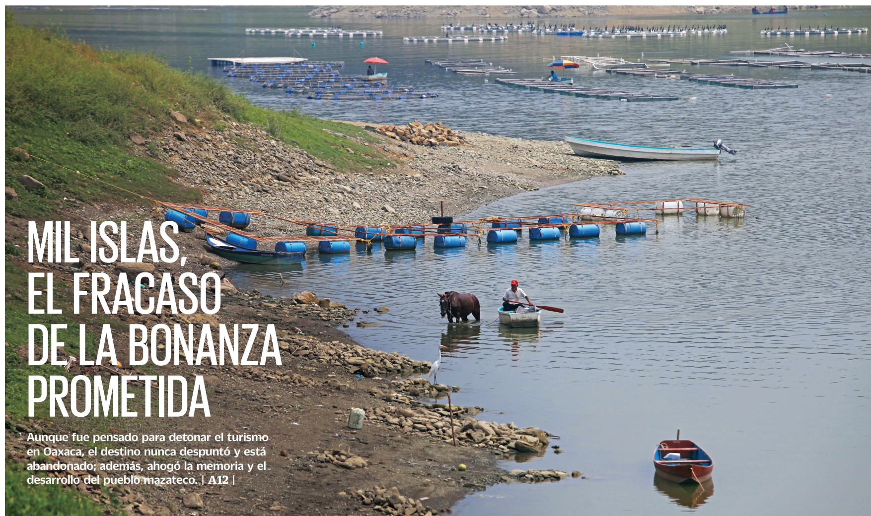
EDWIN HERNÁNDEZ. EL UNIVERSAL