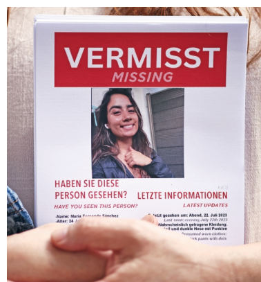
CLEMENS BLAIN. EFE

Aunque fue pensado para detonar el turismo en Oaxaca, el destino nunca despuntó y está abandonado; además, ahogó la memoria y el desarrollo del pueblo mazateco. | A12 |