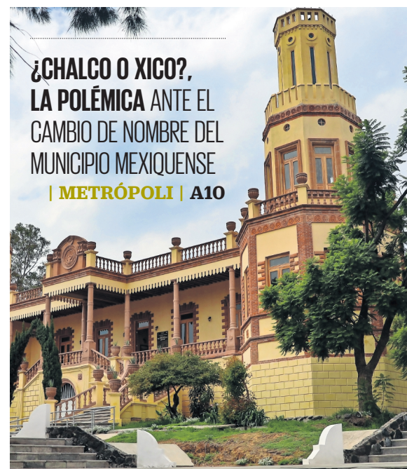
HUGO SALVADOR. EL UNIVERSAL