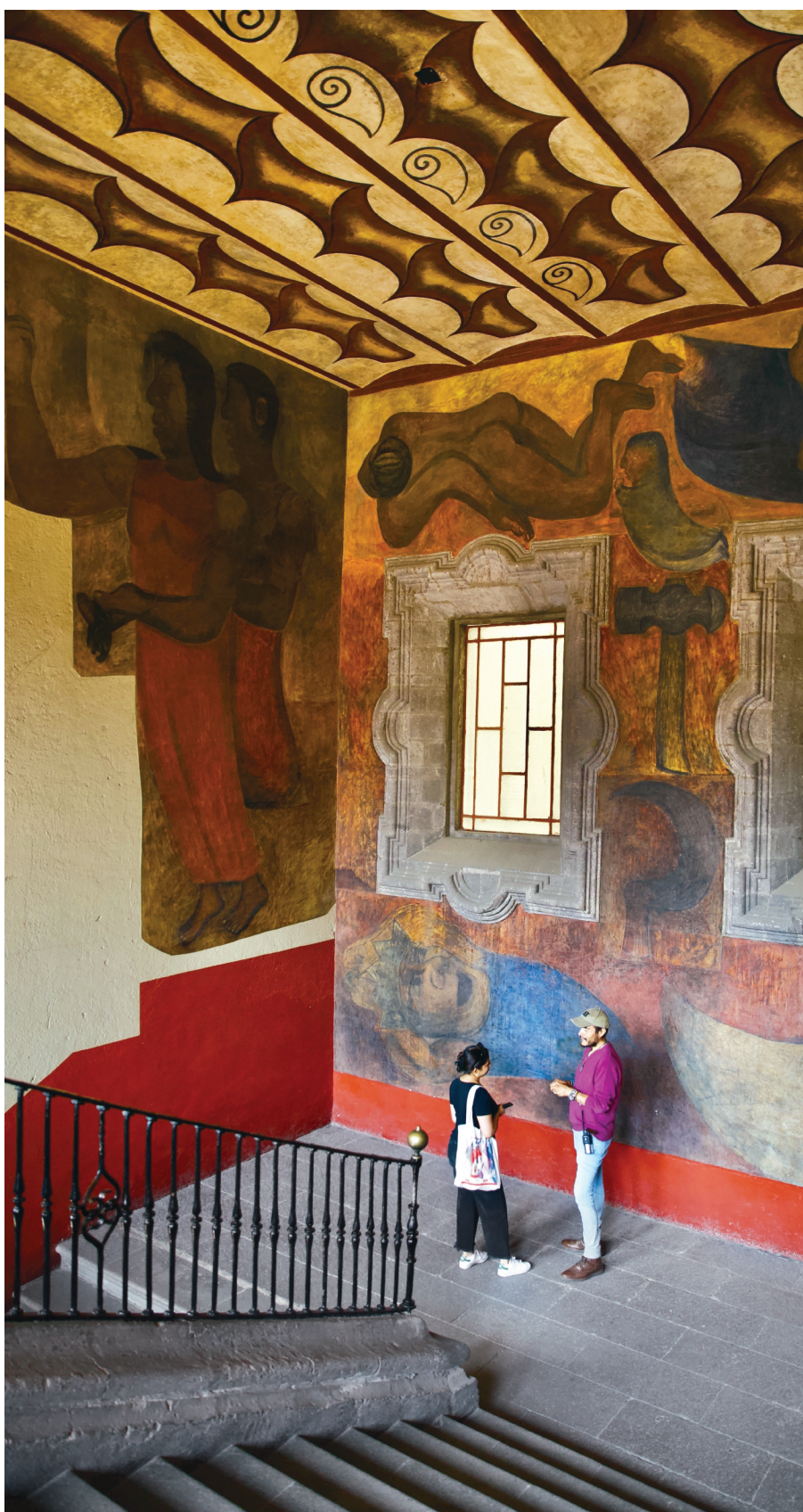
IMAGEN DEL DÍA SIQUEIROS SALEN A LA LUZ