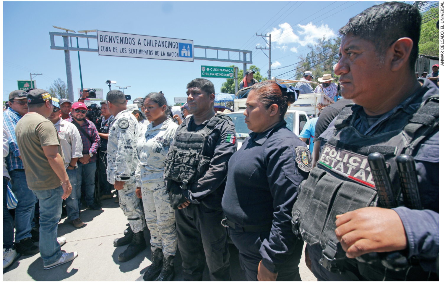
Tras una negociación entre manifestantes y el gobierno estatal, se liberó a los 13 policías, soldados y funcionarios que fueron retenidos el lunes.