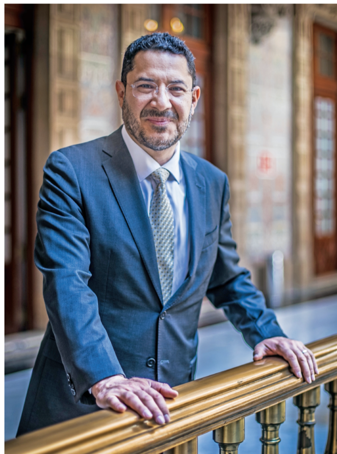
GERMÁN ESPINOSA. EL UNIVERSAL

“NO HABRÁ PERSECUCIÓN; CDMX ES PROGRESISTA, PESE A CONSERVADORES”