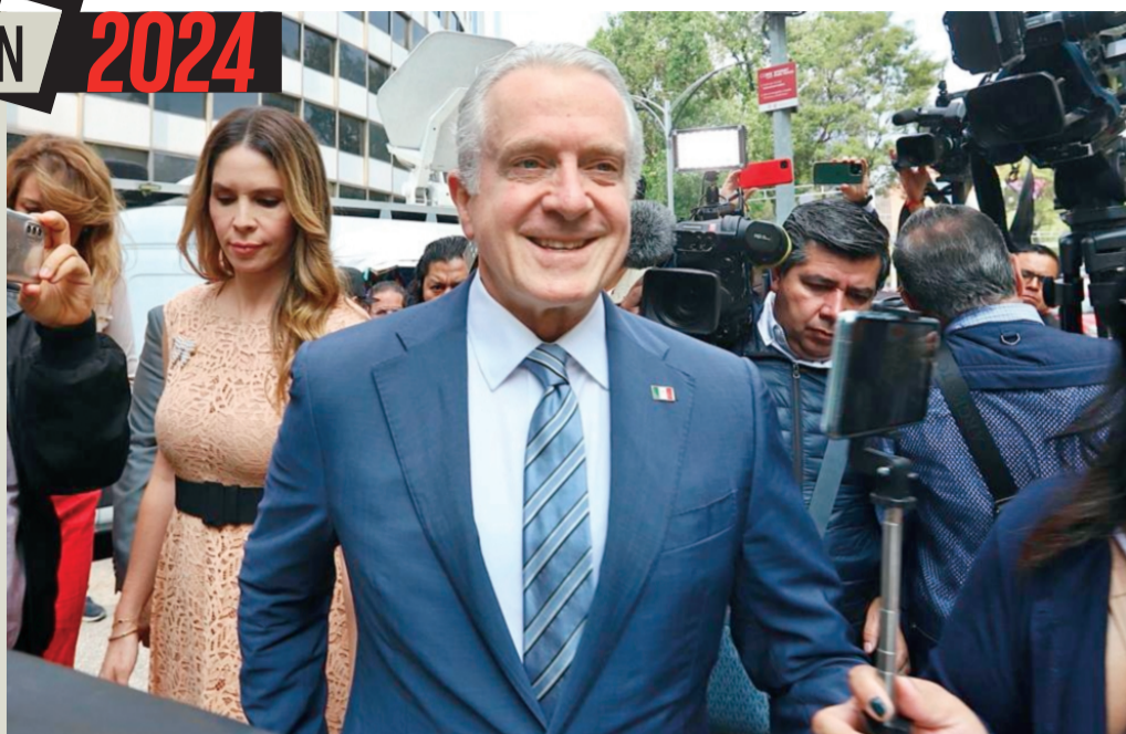
El primero en hacer su arribo fue el presidente de la Cámara de Diputados, Santiago Creel.