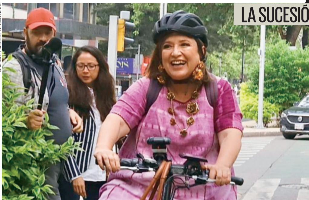
Fiel a su costumbre, Xóchitl Gálvez llegó a la Torre Azul en bicicleta.