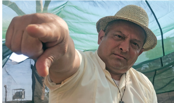
El clérigo rechazó la propuesta del gobernador de dejar la sotana y hacer política porque eso sería "hacernos parte del cáncer social".

Agrega que si Morelia es tan segura como afirma el goberna-