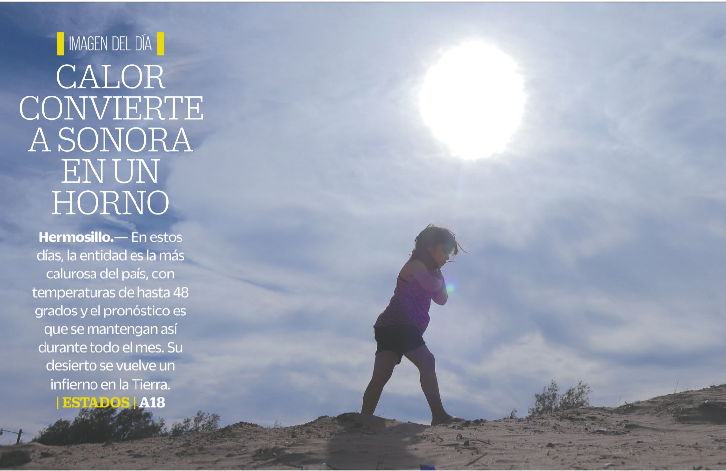
JAVIER ESCOBAR, EL UNIVERSAL