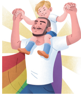
IVAN VARGAS, EL UNIVERSAL