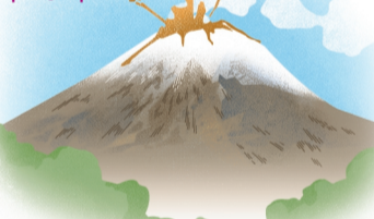
IVAN VARGAS, EL UNIVERSAL