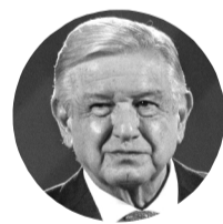
ANDRÉS MANUEL LÓPEZ OBRADOR Presidente de México

"Es ya querer [los ministros] dar un golpe de Estado neutralizando al Poder Ejecutivo, que ya no ejecutemos nada"