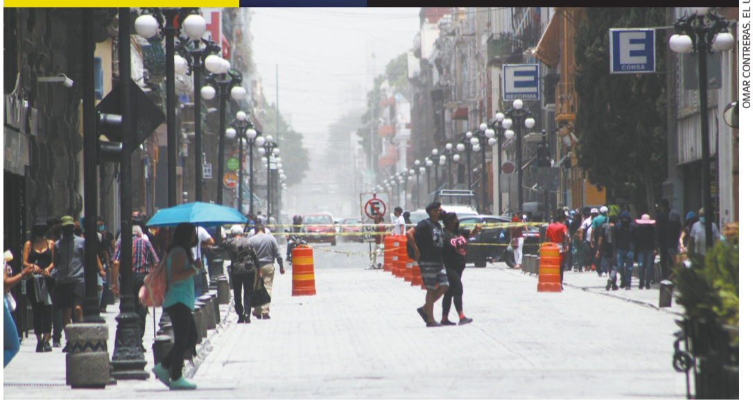
La zona metropolitana de Puebla amaneció ayer con una densa capa de ceniza exhalada por el Popocatepetl, con lo que Protección Civil cambió el Semáforo de Alerta Volcánica a Amarillo Fase 3.

Aumenta el nivel de alerta por el Popocatepetl