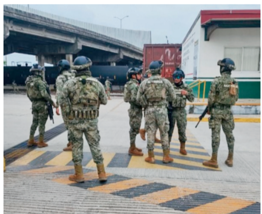
Las Fuerzas Armadas tomaron las instalaciones de Ferrosur por decreto presidencial.