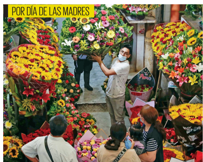
DIEGO SIMÓN SANCHEZ, EL UNIVERSAL