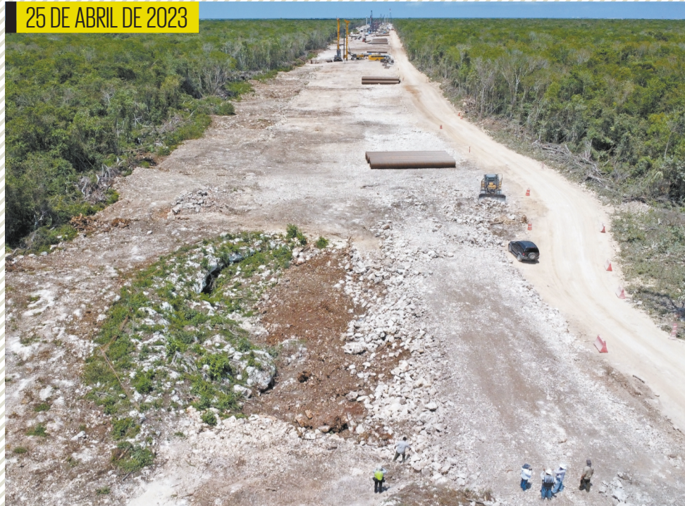
En el terreno aún se podían observar las dos entradas a la cueva Dama Blanca.