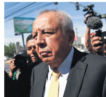
Francisco Garduño, titular del Instituto Nacional de Migración.