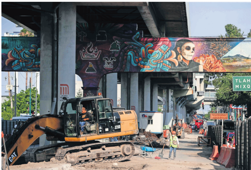
Pese al avance en las obras de reparación de la Línea 12 del Metro, aún no hay fecha de reapertura.