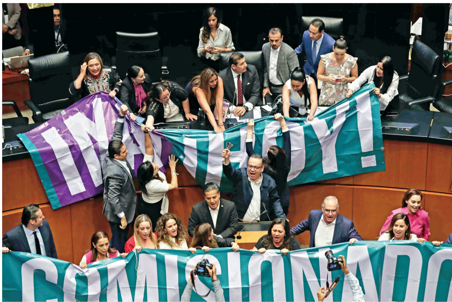
Senadores de oposición tomaron la tribuna y con pancartas exigieron que se vote para nombrar a un comisionado del Inai.

Con la toma de tribuna se quedaron 18 reformas pendientes por aprobar, incluidas iniciativas presidenciales.