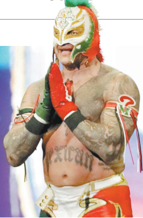
FERNANDA ROJAS, EL UNIVERSAL

Hoy ingresará al Salón de la Fama de la WWE. Es el cuarto luchador mexicano que lo logra. | B2 |