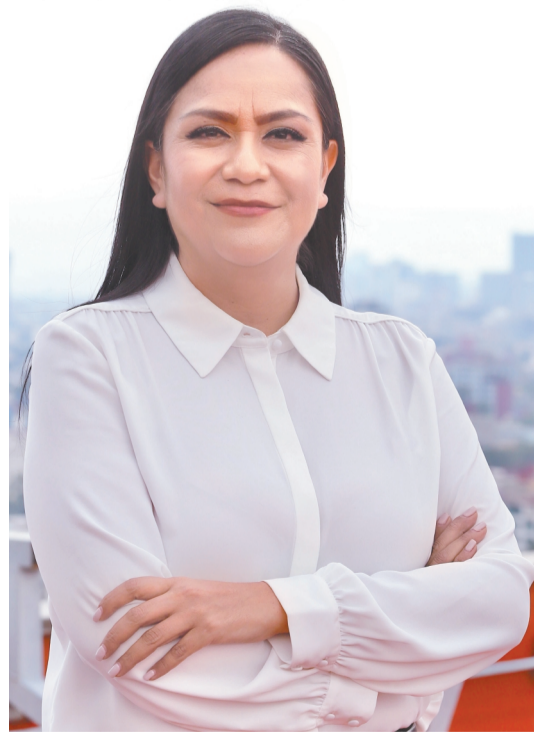
BERENICE FREGOSO, EL UNIVERSAL

"Tengo capacidad e historia política para gobernar la CDMX"