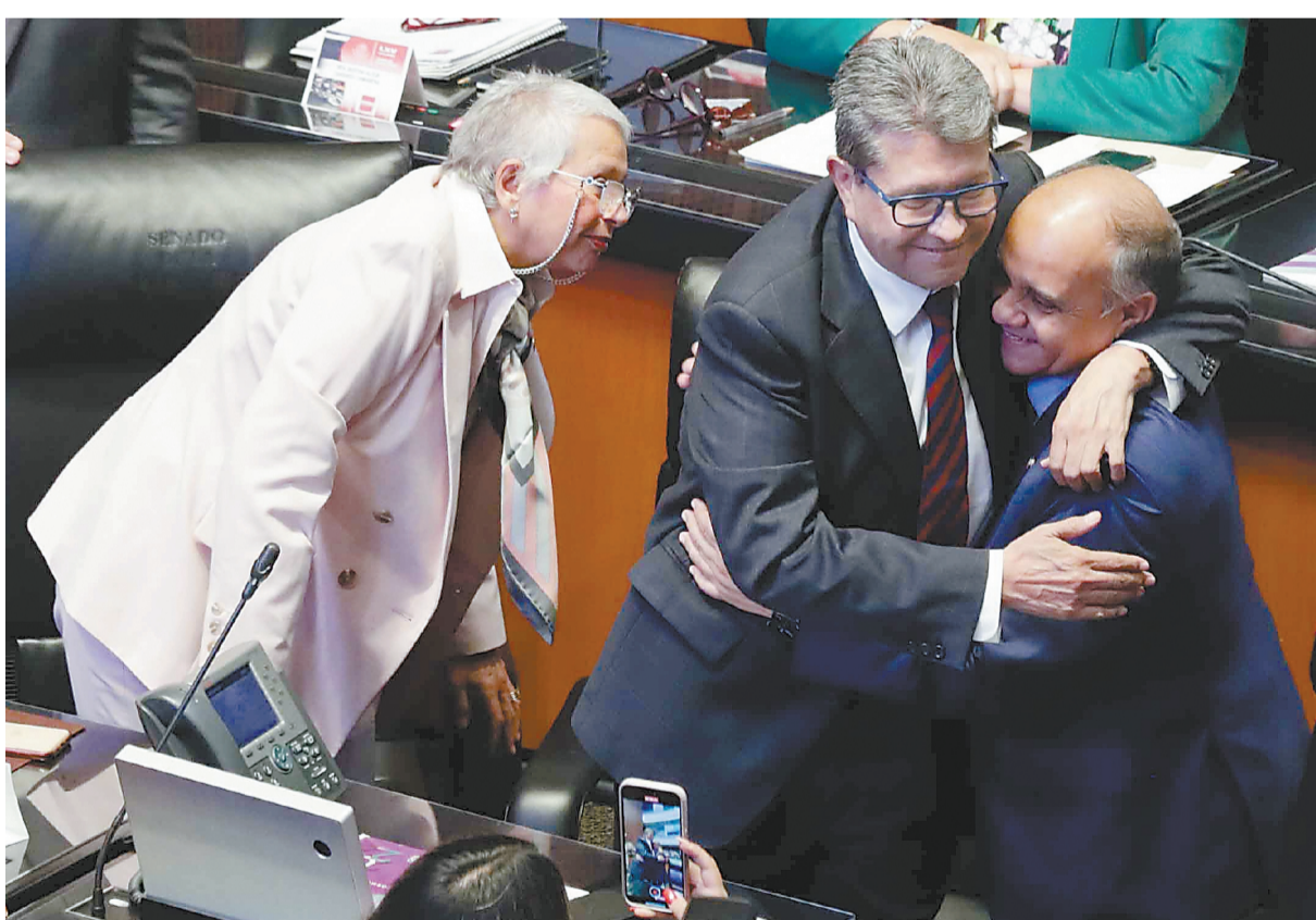
Manuel Añorve, nuevo líder del PRI en el Senado, tuvo un recibimiento muy cálido por parte de los coordinadores parlamentarios de las demás fracciones, como el morenista Ricardo Monreal, quien lo abrazó efusivamente.