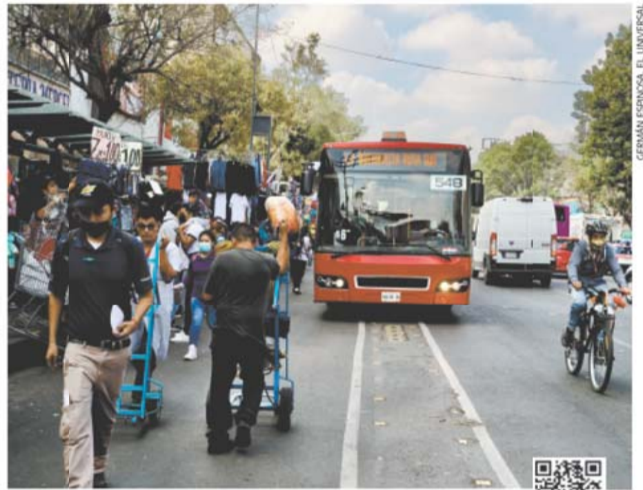
Personas, vehículos y comercio ambulante ocupan los carriles confinados exclusivos para el Metrobús.