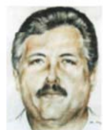
El Mayo Zambada.

Especialistas resaltan que en el narcotráfico participan "familias tradicionales". Tras construir emporios criminales, la mayoría de estos abuelos terminan lejos de sus familias, confinados en cárceles o huyendo de la justicia. | MUNDO | A21