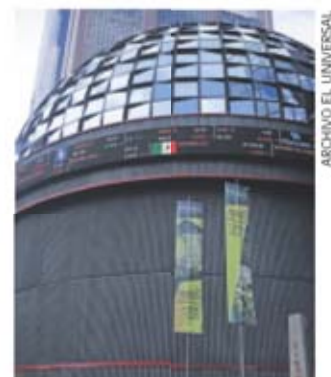
Cotizar en la Bolsa permite obtener recursos a empresas.