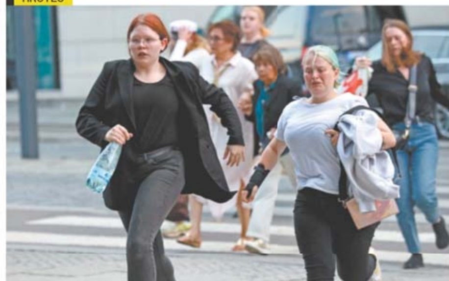
OLAFUR STEINAR GESTSSON/AFIP